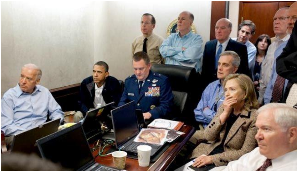
عکسی که کاخ سفید پس از اعلام مرگ بن لادن منتشر کرد